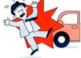
傷害:死亡・後遺障害保険金